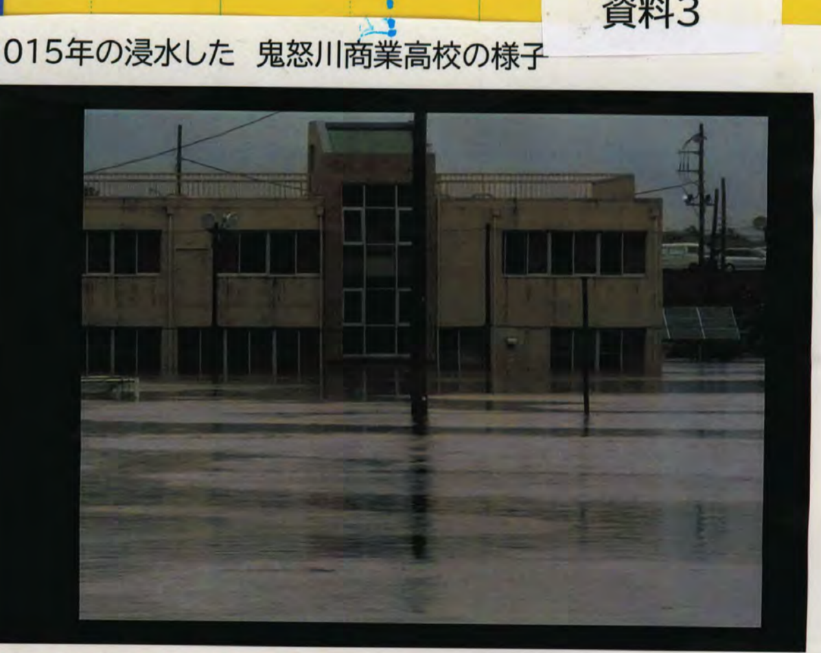
資料3 2015年の浸水した 鬼怒川商業高校の様子 2019年にも浸水している 周辺地域の断面図を見ても、低くなるっているので、鬼怒川と田川で決壊が起こると浸水しやすくなる ことが分かる

資料1から分かるように、結城市には25か所の避難所がある。そこから、自宅に近い避難所を3か所見つけた。 図1に、3か所の避難ルートを色違いの線で示した。 一番近いのが、市民文化センター【うす紫】である。2番目に近いのが鹿窪運動公園【青】、3番目が城南小学校【紫】であった。いずれも、徒歩で避難できる場所を選定した。理由は、地震などで道路の陥没や交通渋滞が考えられる為、車を使わない避難ルートを選んだ。