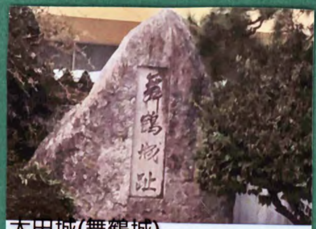
太田城(舞鶴城) 遺構 土塁、郭 城主 佐竹氏 形勝 平山城 21