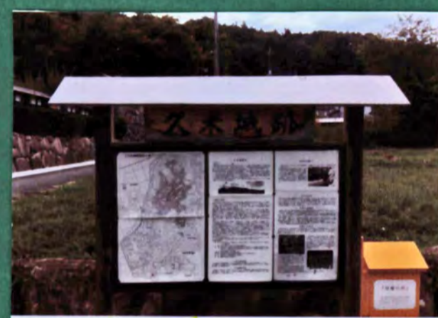
久米城跡 遺構 土塁、郭、堀 城主 久米氏、佐竹氏 形勝 平山城 13