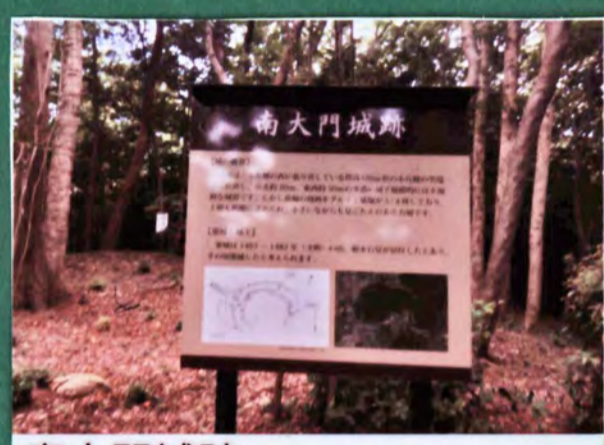
南大門城跡 遺構 土塁、郭 城主 勘川氏、津川氏、榎本氏 形勝 平山城 17