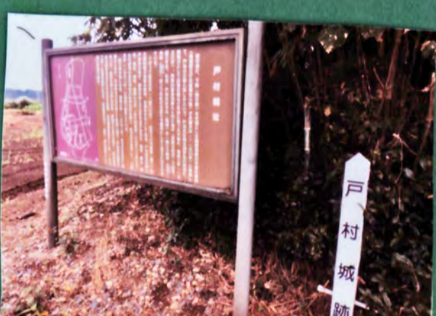
戸村城跡 遺構 土塁、堀 城主 佐竹氏、戸村氏 形勝 平城 33