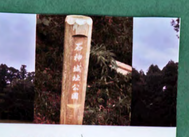
石神城跡 遺構 土塁、郭、堀 城主 石神氏 形勝 平山城 36