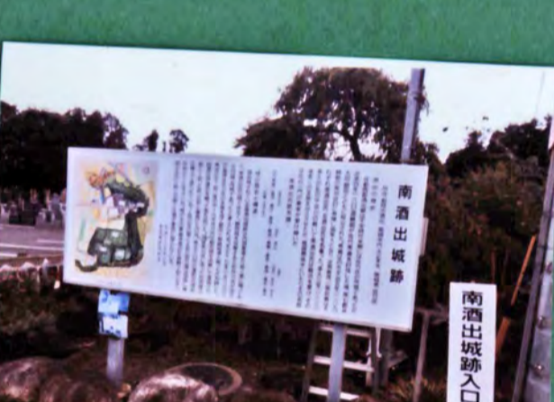
南酒出城跡 遺構 土塁、郭、堀 城主 南酒出氏 形勝 平山城 34