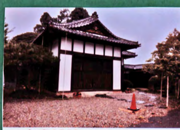
大窪城跡 遺構 土塁、郭、堀 城主 大窪氏 形勝 平山城 28