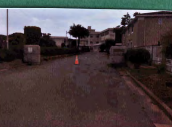
小野崎城跡 遺構 なし 城主 小野崎氏 形勝 平山城 20