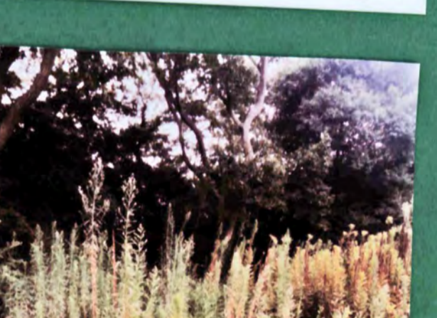
真崎城跡 遺構 郭、堀 城主 真崎氏 形勝 平山城 37