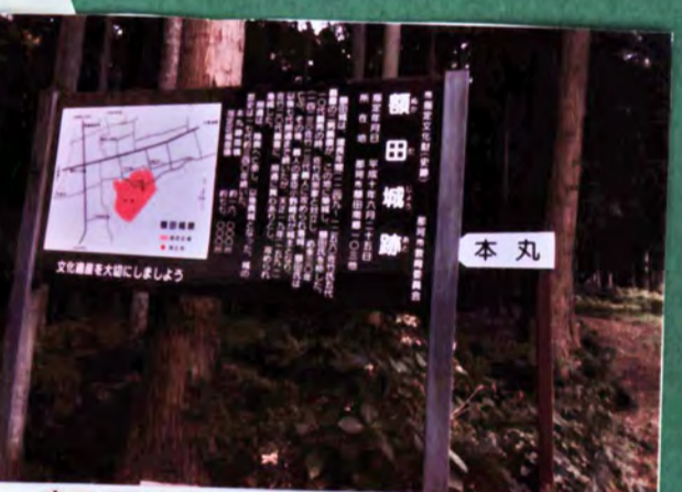
額田城跡 遺構 土塁、郭、堀 城主 佐竹氏、額田氏、小野崎氏 形勝 平山城 35