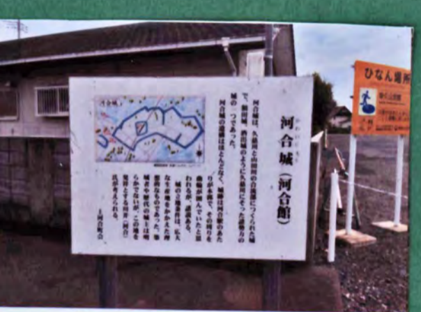
河合城 遺構 土塁 城主 川野氏 形勝 平城 22