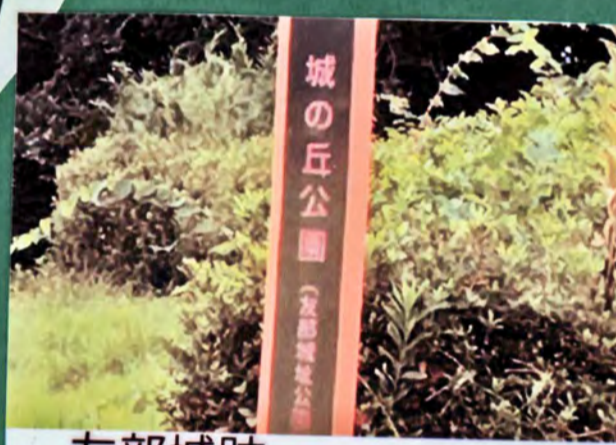
友部城跡 遺構 郭、堀 城主 小野崎氏 形勝 平山城 26