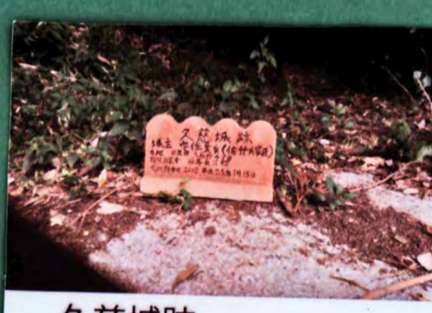
久慈城跡 遺構 土塁、郭、堀 城主 宇佐美氏 形勝 平山城 31