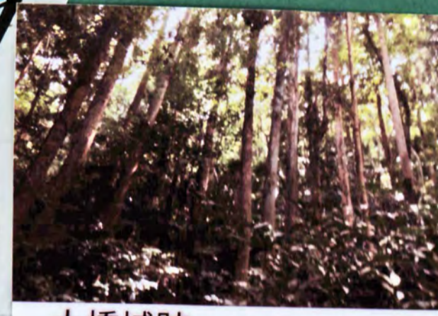
大橋城跡 遺構 土塁、郭、堀 城主 平野氏 形勝 平山城 32