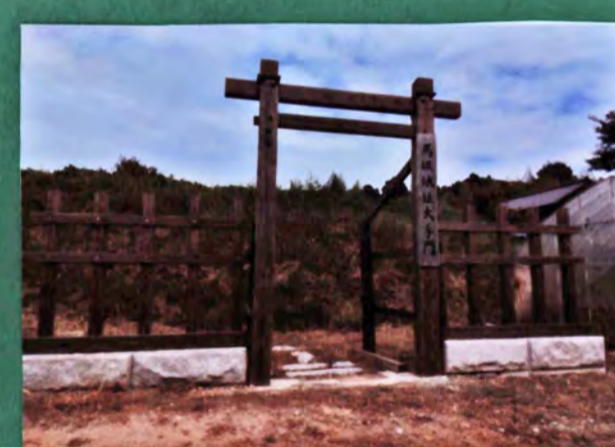
馬坂城跡 遺構 土塁、郭、堀 城主 天神村氏、榎木氏、佐竹氏 形勝 平山城 23