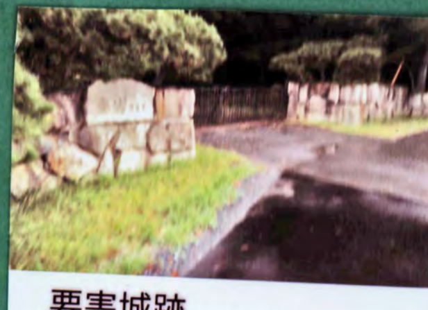
要害城跡 遺構 土塁、郭、堀 城主 孫次氏、若尾氏 形勝 平城 30