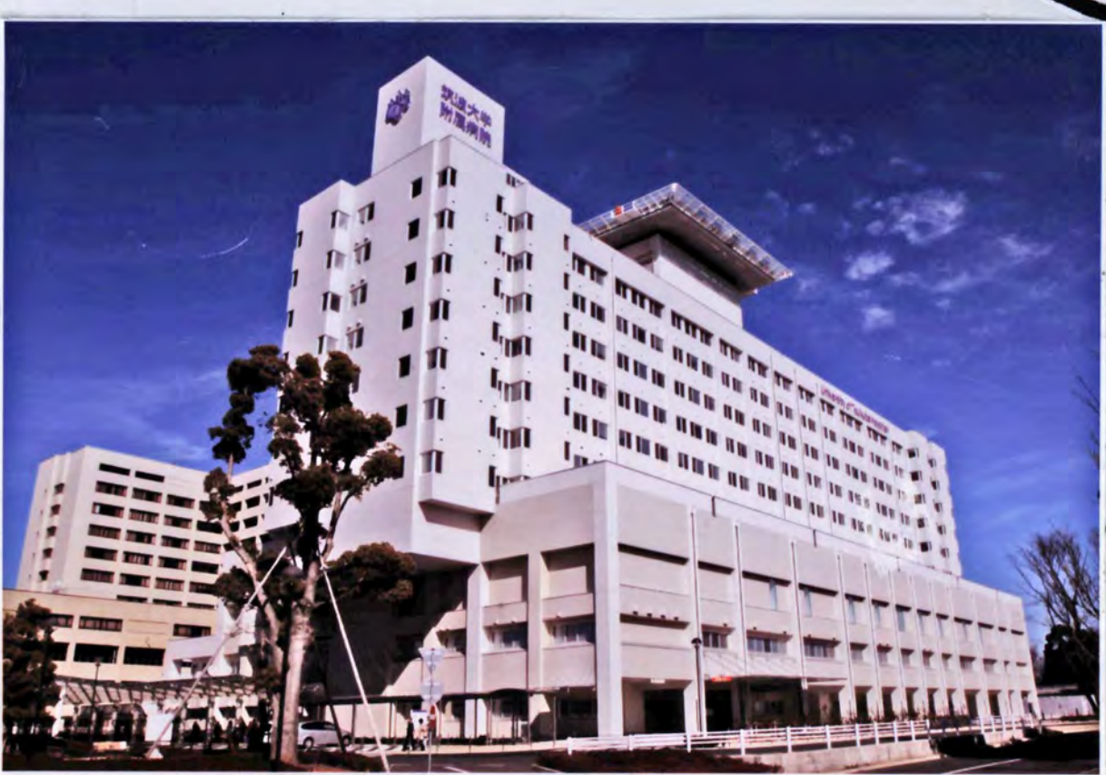
筑波大学附属病院ホームページより https://www.hosp.tsukuba.ac.jp/ccc/ 最終アクセス日 2022年8月15日

国土地理院ホームページより「地理院地図/GSI Map」 https://maps.gsi.go.jp 最終アクセス日 2022年8月12日