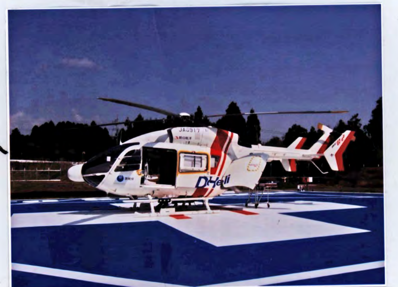
茨城県ホームページより「ドクターヘリとは」(機体紹介) https://www.pref.ibaraki.jp/hoken/fukushi/iryo/iryo/fsei/doc_heri_concept.html 最終アクセス日 2022年8月15日

「イバラキ ドクターズライフ」ホームページより「茨城の医療について」 茨城県の医療提供体制 https://ibaraki-dl.jp/about/ https://ibaraki-dl.jp/wp-content/uploads/2022/04/c11c3901b5c7244c90af534075c2d369.pdf 最終アクセス日 2022年8月12日