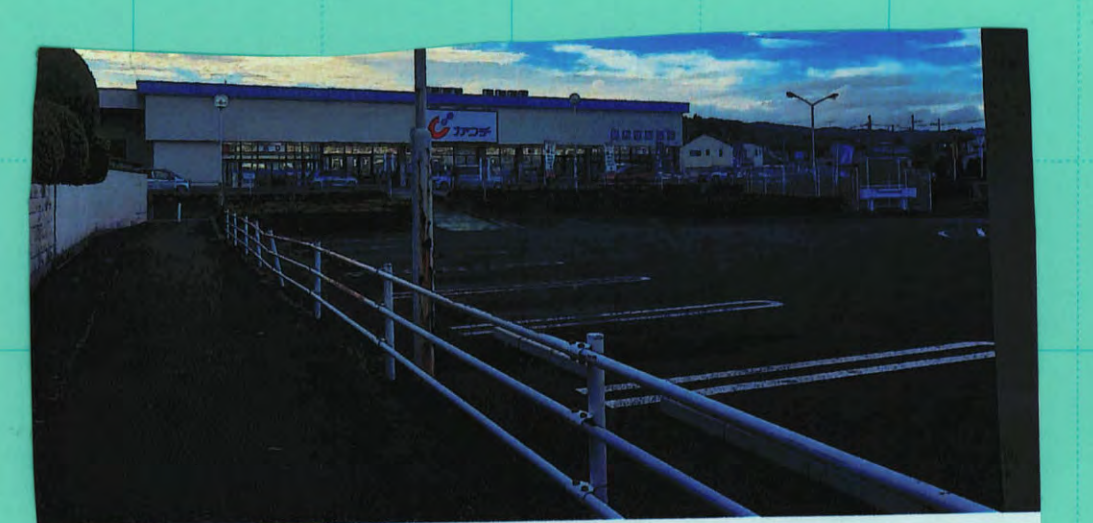
昔、カワチのあたりほとんど空地