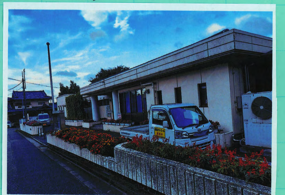
昔、ここらへん全て畑!!