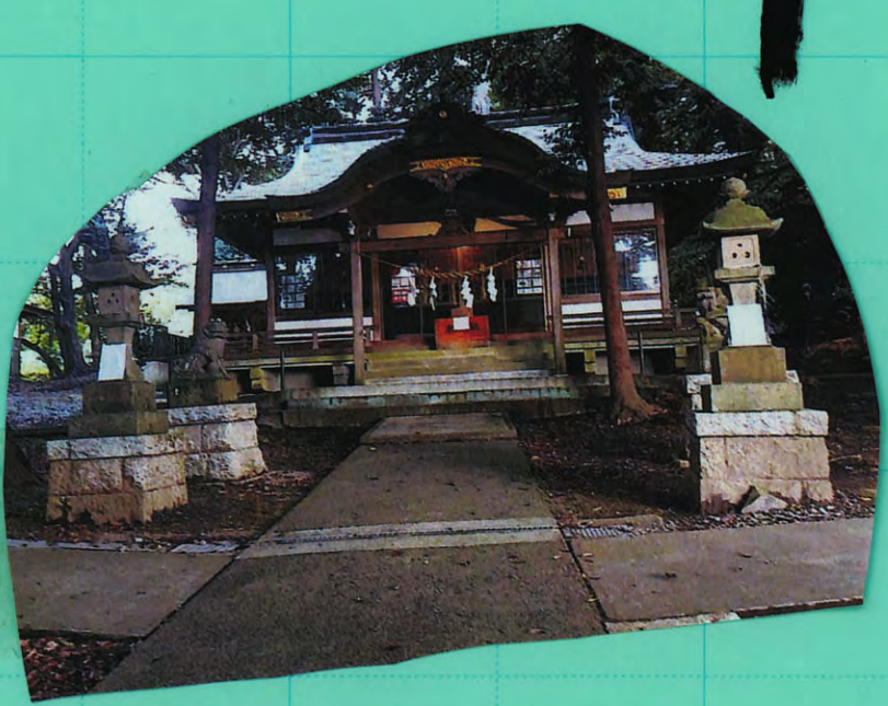
昔からま、なく変わっていた