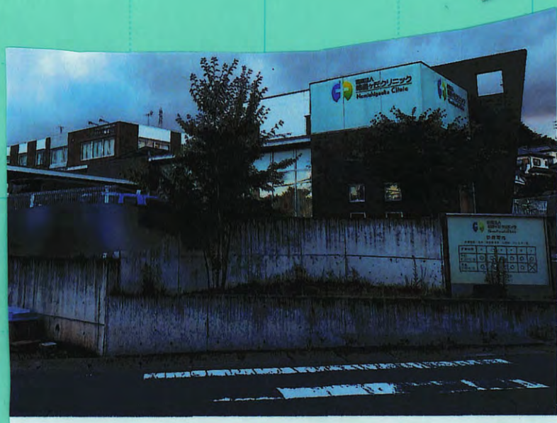
元はコンビニだった