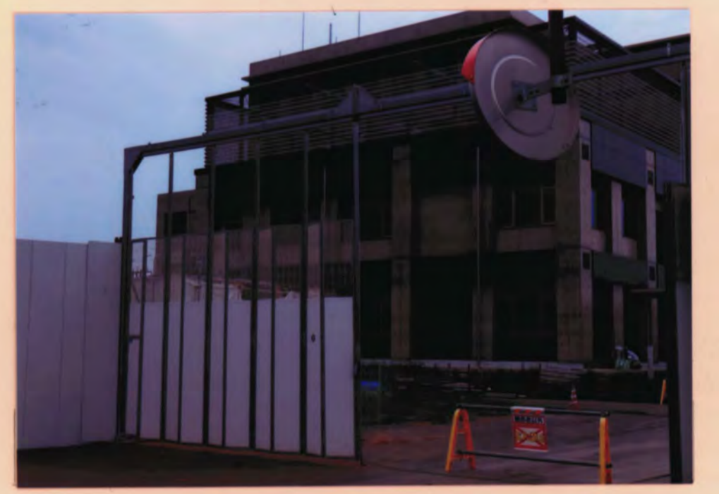
つくば警察署(仮称) 4

学園の森3丁目に建設中。 (2019年8月現在) 2020年開署予定。 つくば中央警察署とつくば北警察署を統合した。