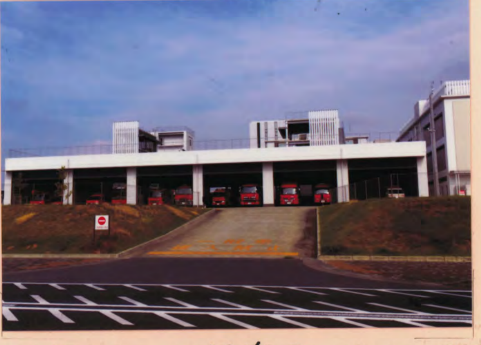
つくば市中央消防署 3

2015年3月に研究学園一丁目に移転。 東日本大震災の被災経験から庁舎を免震構造にし最新システムを導入。 市役所の隣なので災害時に迅速な初動体制が期待される。