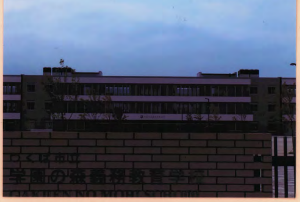
学園の森義務教育学校 1

平成30年度開校。 新設にも関わらず大幅な生徒数の増加により、教室が不足。 2022年までに27教室を増築予定。